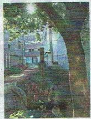
「お玉が池児童遊園」にある池跡の木柱

【アクセス】都営地下鉄新宿線若本町駅が最寄り駅。「繁栄お玉稲荷一や、お玉ヶ池種痘所跡」などに往時の痕跡をとどめる。