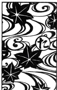
題字デザイン・イラスト